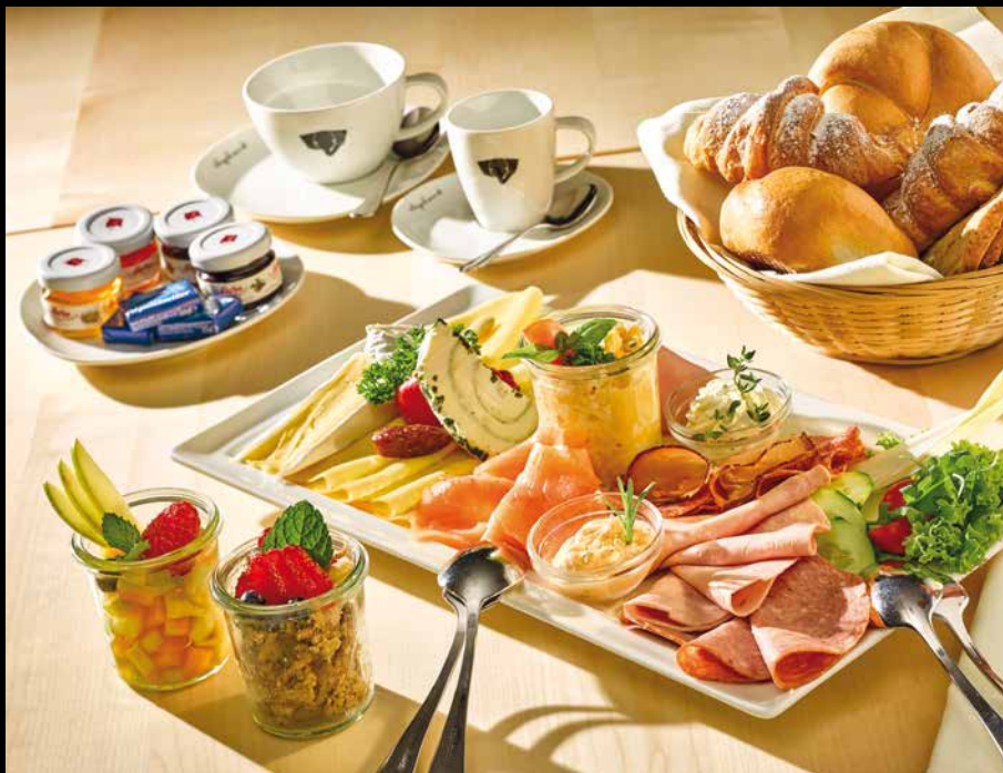
Elephant Frühstück für 2 Personen

Croissant, Semmel, Schwarzbrot, Butter, Marmelade, Honig, vegetarische Aufstriche, Gemüsesticks, Weich- und Hartkäse, Fruchtsalat