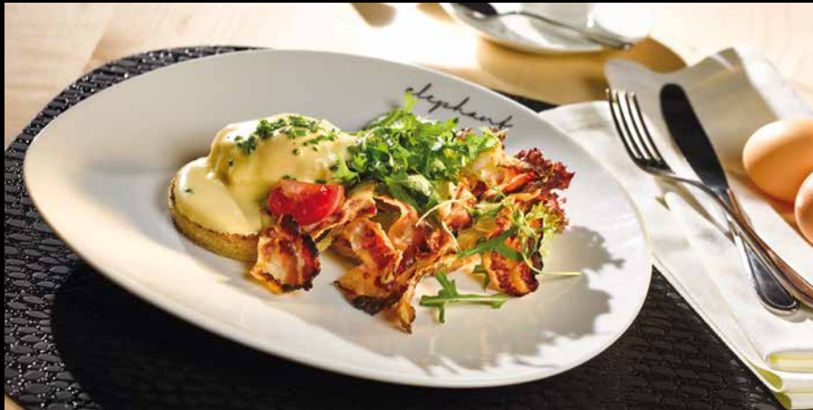
„Elephant meets Benedict“