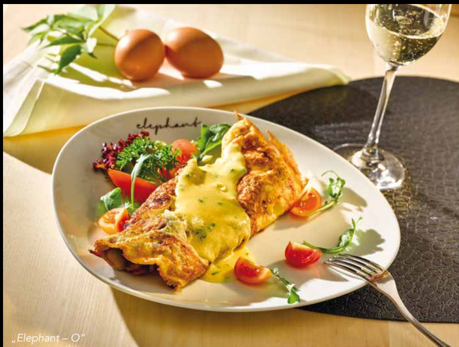
„Elephant – O“