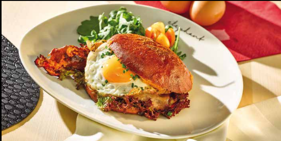
„Good Morning“ Elephant-Burger